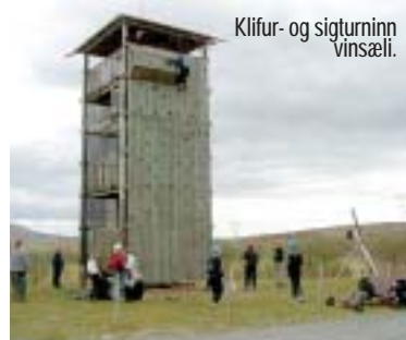
Klífur- og siglturninn vinsæli.

Á síðusta áratug hafa um tveir tugir þúsunda barna komið til dvalar að Úlfljótswatni. Margir eiga þaðan góðar minningar og margir koma aftur og aftur og aftur. Um þessar mundir fagnar staðurinn 60 ára starfi á staðnum og í tilefni af því er þessi kynning sett saman. Tilgangurinn er að rifja upp gömul kynni og stofna til nýrra. Allir eru velkomnir á Útilífsmiðstöð skáta Úlfljótswatni.