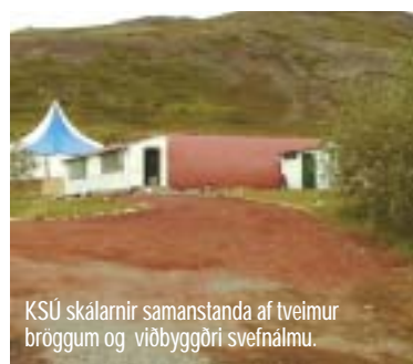
KSÚ skálarnir samanstanda af tveimur bröggum og viðbyggðri svefnalmu.

Útilífsmiðstöð skáta Úlfljótswatni er aðal þjálfarnamiðstöð skátahreyfingarinnar og hefur verið svo í áraraðir. Stór hluti af námskeiðahaldi hreyfingarinnar fer fram á staðnum. Skátafélög landsins fara með skátana sína þangað í stærri og minni útilegur í skálunum eða á tjaldsvæðunum. Á staðnum halda skátar reglulega landsmót sín og var síðast haldið þarna landsmót skáta árið 1999 og voru þá um 4000 þátttakendur á mótiinu í vikutíma og næsta landsmót skáta mun verða á staðnum árið 2005. Næsta sumar mun verða haldið