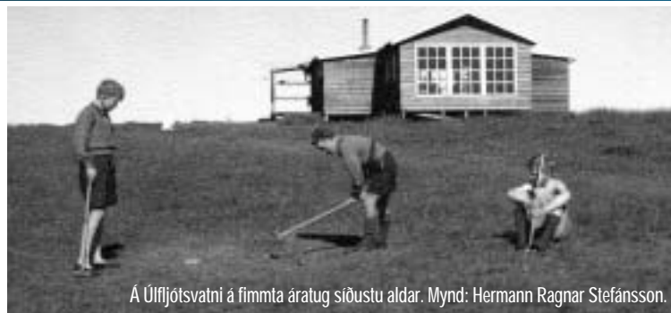
Á Úlfjótssvatni á fimmta áratug síðustu aldar.

Jurtalíf er hér mjög fjölskrúðugt og því