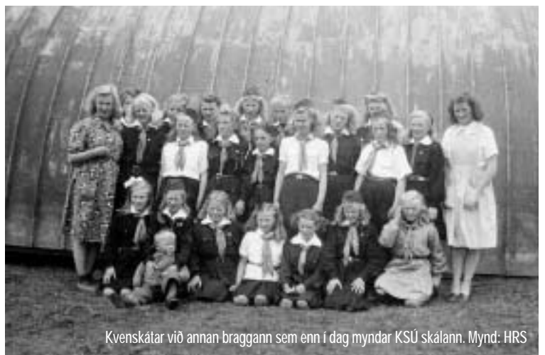
Kvenskátar við annan braggann sem enn í dag myndar KSÚ skólann.

■ Haustið 1943 var ákveðið að skátarnir tækju búskapinn á staðnum í sínar hendur. Var það stórt spor og nú þegar lítið er til baka má segja að það hafi ekki