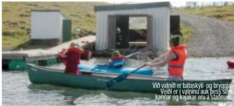
Við vatnið er bátaskýli og bryggja. Veði er í vatninu auk þess sem kanoar og kajakar eru á staðnum.

Mikil uppbygging hefur átt sér stað á staðnum. Fram undir síðasta áratuginn var staðurinn fyrst og fremst byggður upp með sumarþúðir í huga og því var áhersla lögð