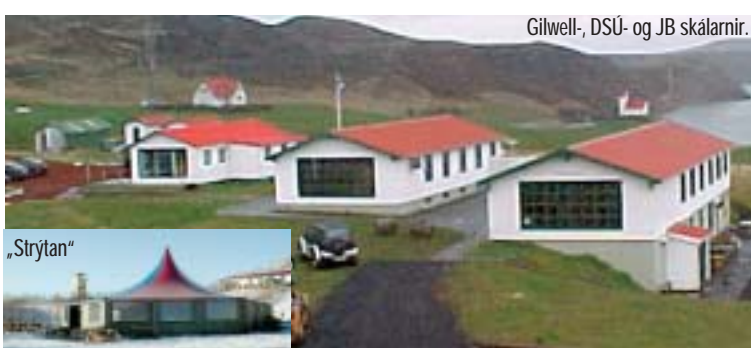
Gilwell-, DSÚ- og JB skálarnir.